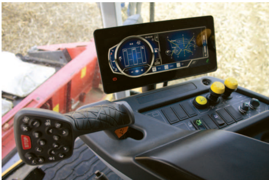
Obr.: Ovládání mlátičky Sampo Rosenlew Comia C20 – včetně lišty – se provádí přes multifunkční páku

P & L, spol. s r. o. tel.: +420 577 113 980 e-mail: info@pal.cz www.pal.cz