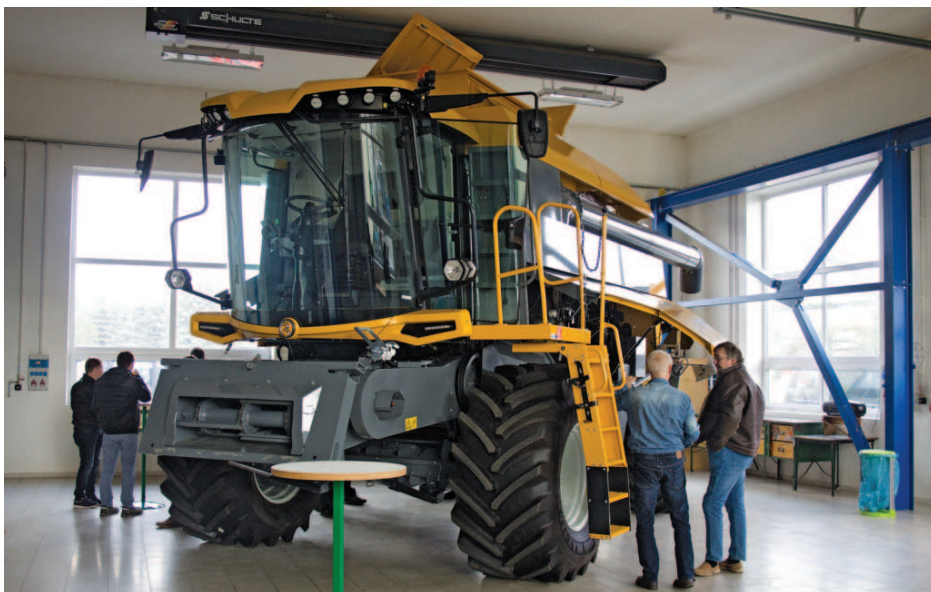
Obr.: Na akci si bylo možné prohlédnout model Comia C12

Sampo Rosenlew má dlouhou historii. Hlavní výrobní závod se nachází v centru finského města Pori. Jelikož stává na tradici, výroba se stále nachází v původních, avšak rekonstruovaných historických budovách. Obrat společnosti za rok 2018 činil 50 milionů eur. Práci ve společnosti naleznou 400 zaměstnanců. Sklízecí mlátičky si Sampo Rosenlew vyvíjí a vyrábí ve vlastní režii, v žádném případě se nejedná o okopírované stroje. Sampo Rosenlew začínalo