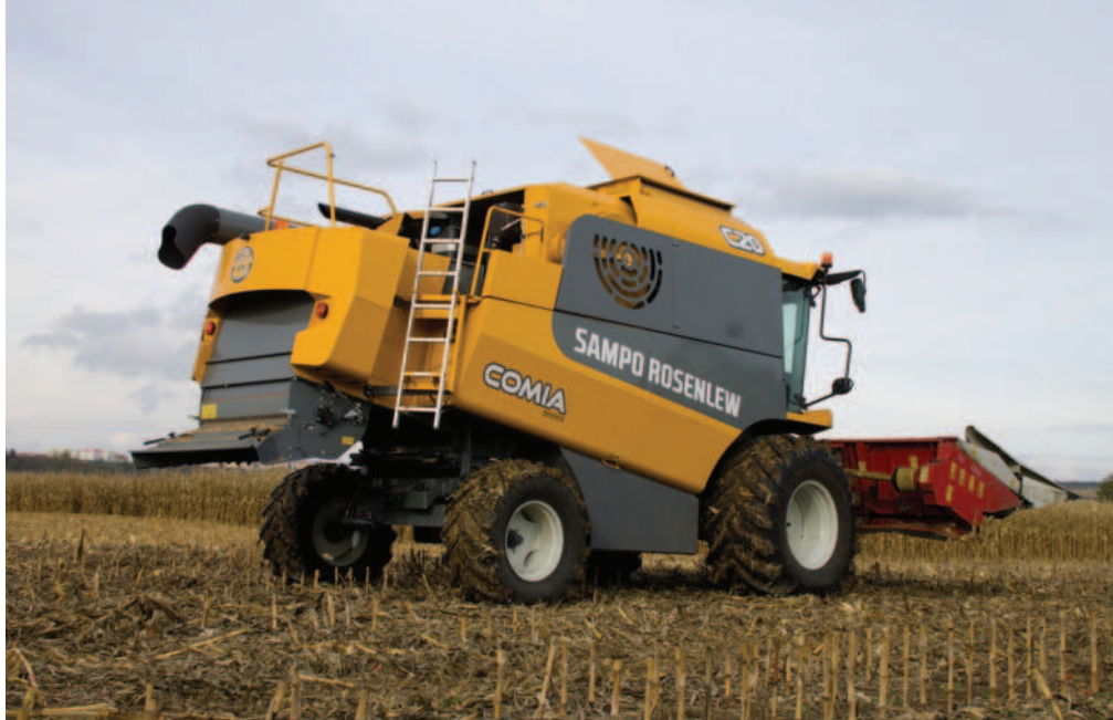
Obr.: Nová hybridní sklízecí mlátička Sampo Rosenlew Comia C20 při premiéře v ČR

Marek Psota produktový manažer Sampo Rosenlew všem představil přednosti modelů C6, C8, C10 a C12 které nabízí prostornější kabinu s perfektním LED osvětlením a výhledem dopředu a dozadu. Pohodlí bylo vyvíjeno na základě požadavků zemědělců, takže uvnitř kabiny nechybí odpružená sedačka včetně sedačky spolujezdce. Ovládání je nyní jednodušší, v kabině se nachází 12palcový monitor s intuitivním ovládáním. Monitor kromě důležitých dat nabízí obraz i z couvací kamery. Ovládací joystick má specifické tvarování, které obsluha ocení při dlouhých sklíz-