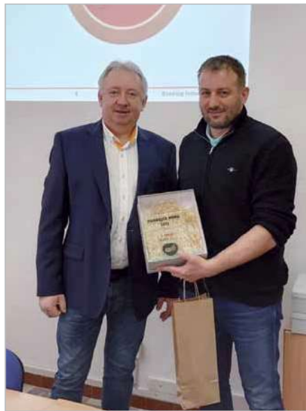
Firma AMBY se v rámci tuzemské dealerské sítě umístila v loňském roce v prodeji traktorů Kioti na třetím místě