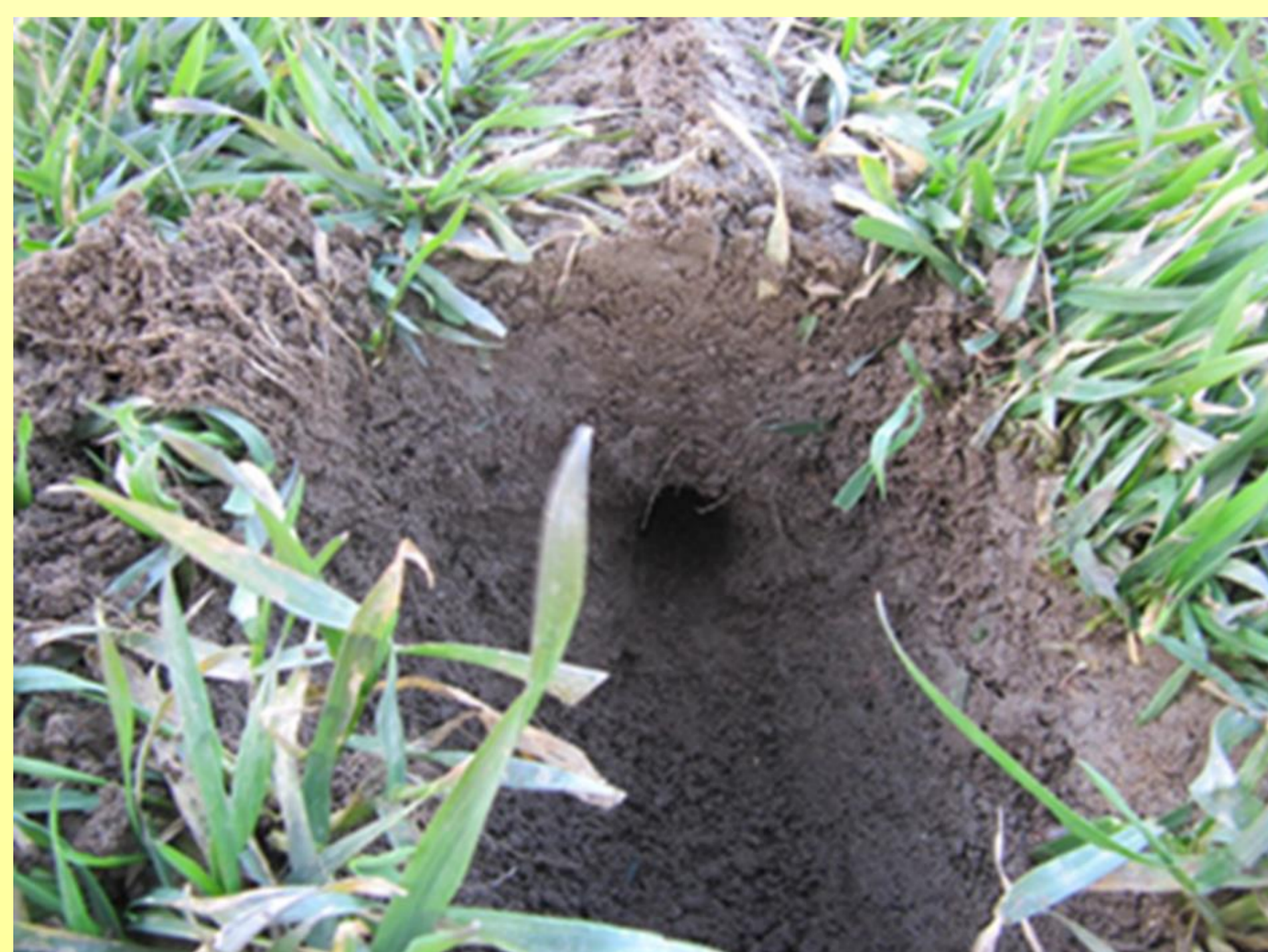
Podpovrchová dutina (nora)