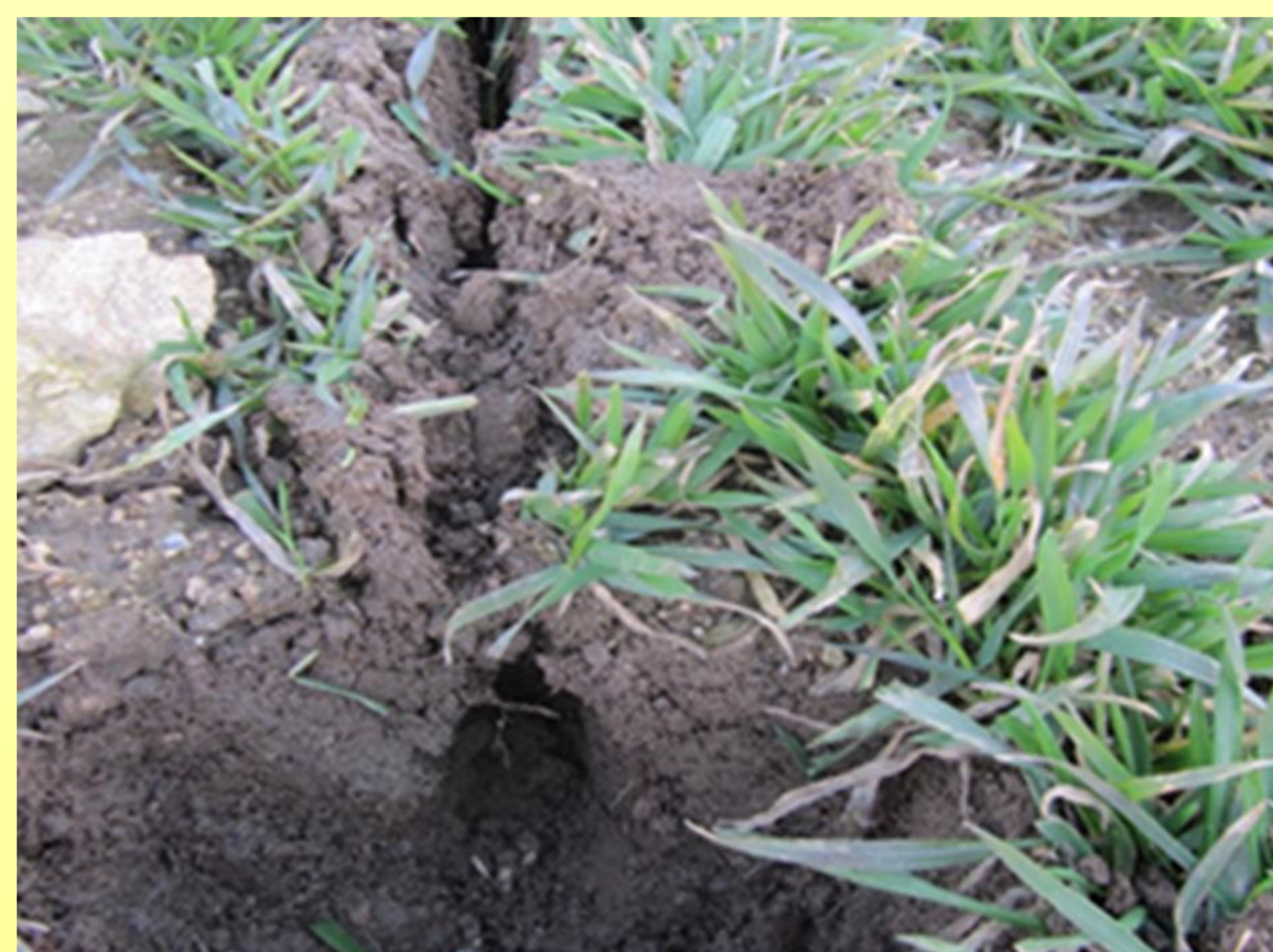
Dutina s otvory pro snadnější přístup hraboše k návnadě