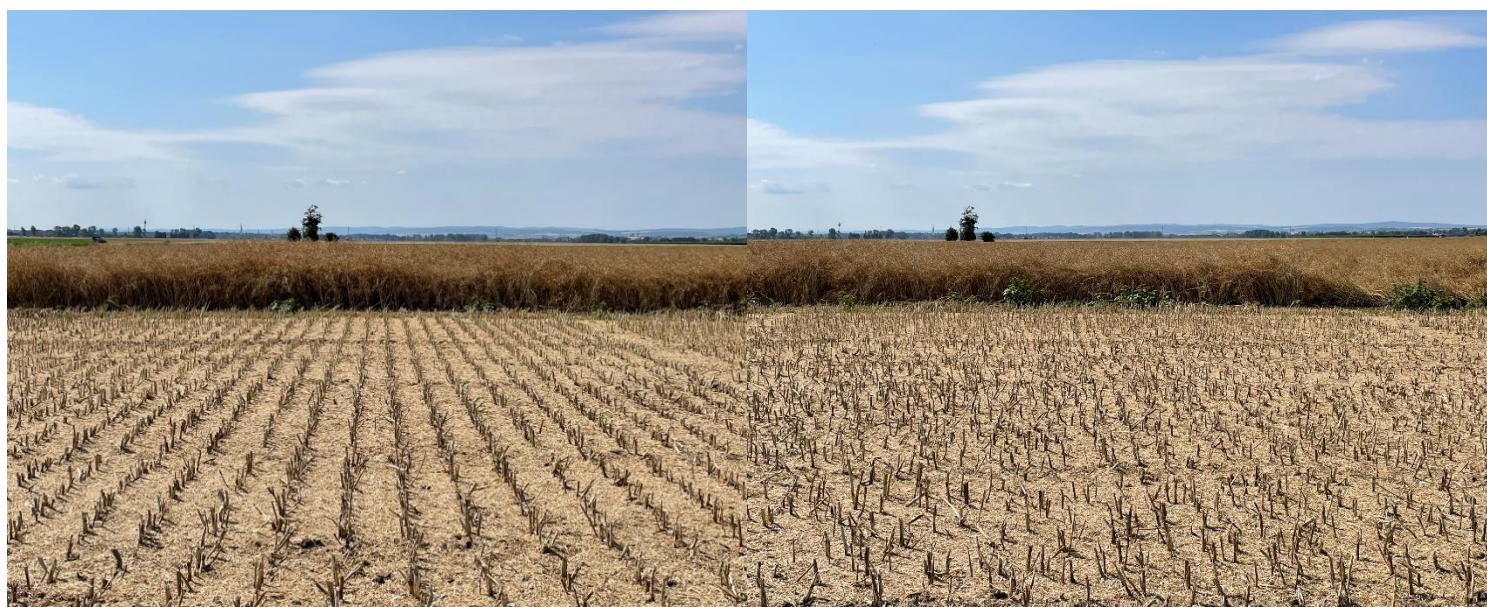
Na strništi byl patrný rozdíl v mohutnosti rostlin a větvení již od nadzemní části rostlin ve prospěch přesného setí (vlevo – přesné setí) na rozdíl od konvenčního porostu (vpravo). Foto 16.7.2022