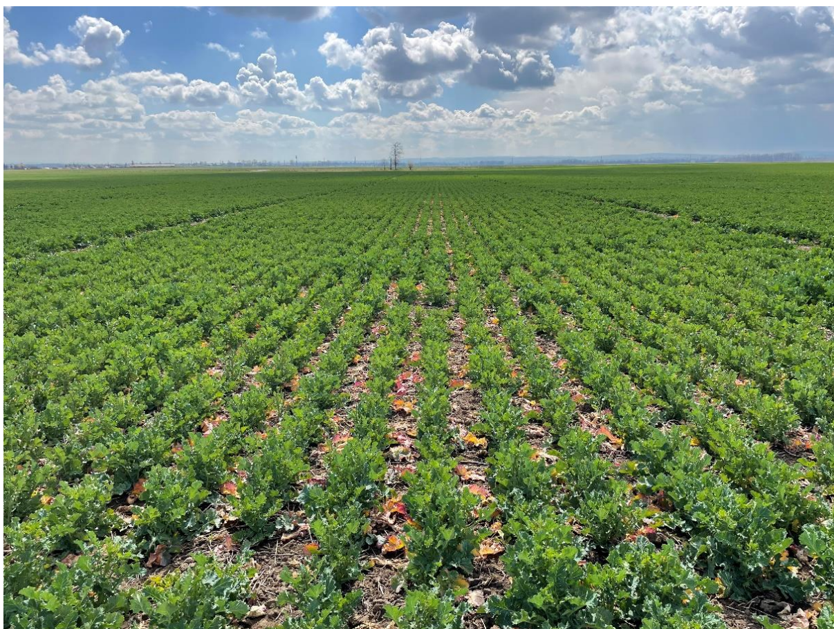
Porost setý přesným secím strojem Kinze, rozteč řádků 37,5 cm výsevek 250 tis. jedinců/ha. Foto 11.4. 2022