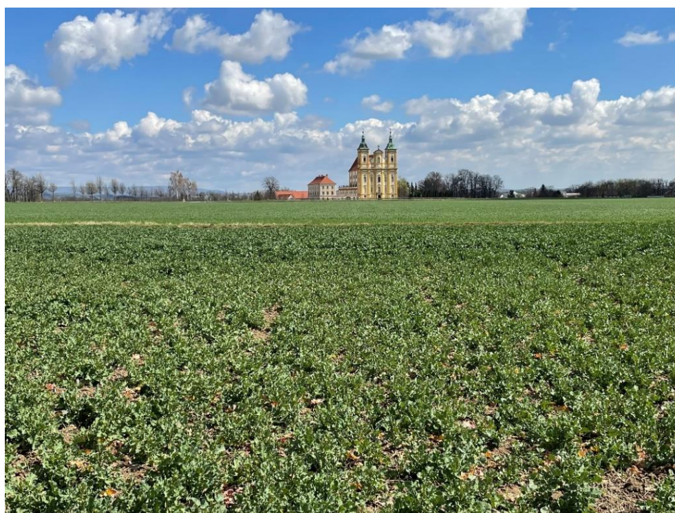
Porost zasetý obilním secím strojem s výsevkem 500 tis. jedinců/ha. Foto 11.4. 2022