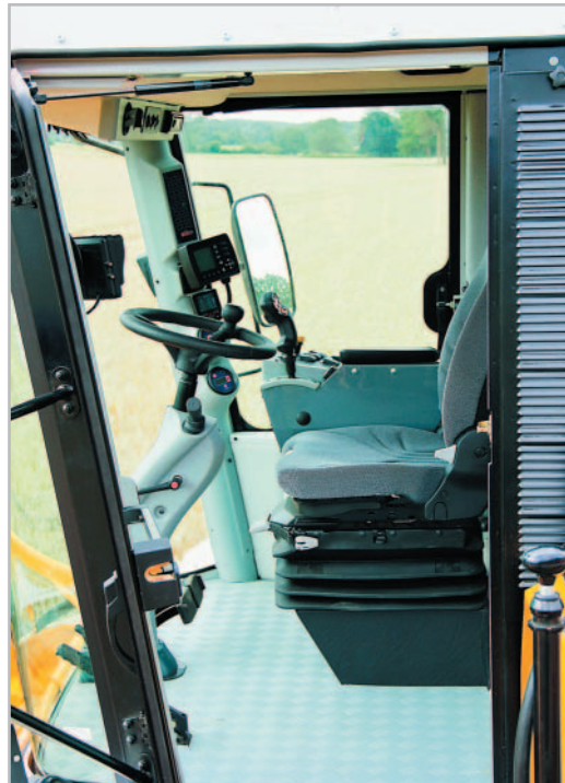
Zcela nová klimatizovaná kabina s novými systémy je mnohem tišší než dříve

nu 210 koní nahrazuje modely úspěšné řady 2000. Má velmi efektivní systém přívodu vzduchu k motoru. Rotační samočisticí síto je navíc vybaveno mechanismem, který odsává nečistoty z jeho povrchu. Díky tomu lze pracovat se sklízecí mlátičkou Comia nepřetržitě za všech podmínek po celý den.