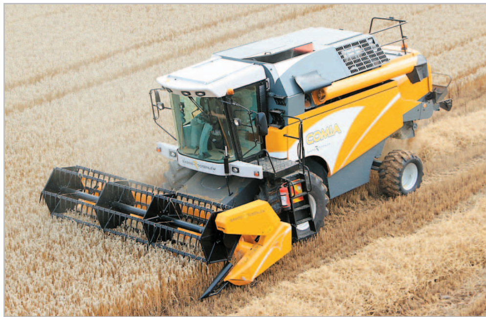
Žlutá mlátička Sampo Comia C 8 se záběrem lišty 5,1 m a pohonem všech kol je určena především menším či středním farmářům