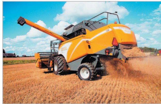
V základní výbavě mlátiček Comia je také drtič

lance. Tento způsob známý především z velkých sklízecích mlátiček zlepšuje torzní vlastnosti celého stroje. Nový rám umožnil také použití silnějších hřídel, například pro hlavní mlátičící buben. Zcela nový je také design, na kterém se svými návrhy podíleli i zemědělci.