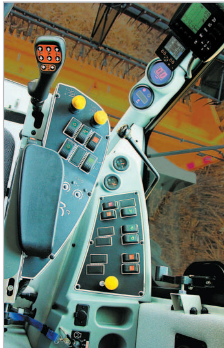
Všechny hlavní vypínače lze ovládat pravou rukou