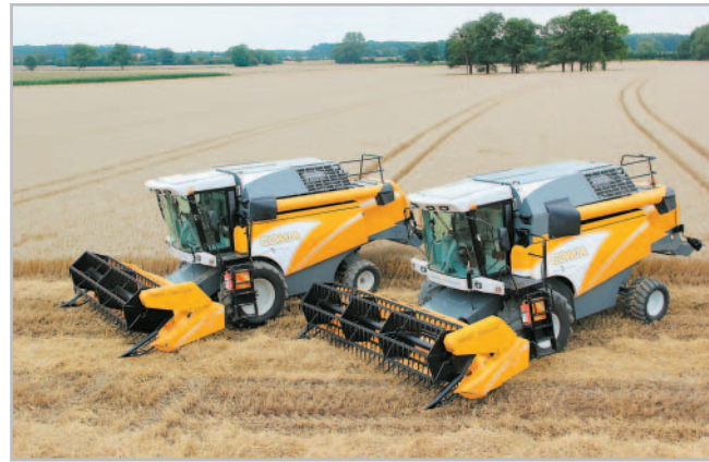
K optimální práci sklízecích mlátiček Sampo Comia přispívají i vysoký točivý moment a klidný chod motoru

Již v letošních žních bude minimálně pět nových modelů Comia pracovat na polích v České a Slovenské republice. Silný potenciál nových mlátiček se tak potvrzuje nejen v celé Evropě, ale i v našich zeměpisných šířkách. Ke všem již zmíněným přednostem mlátiček Comia je třeba ještě přičíst velmi zajímavou cenu, takže pro většinu