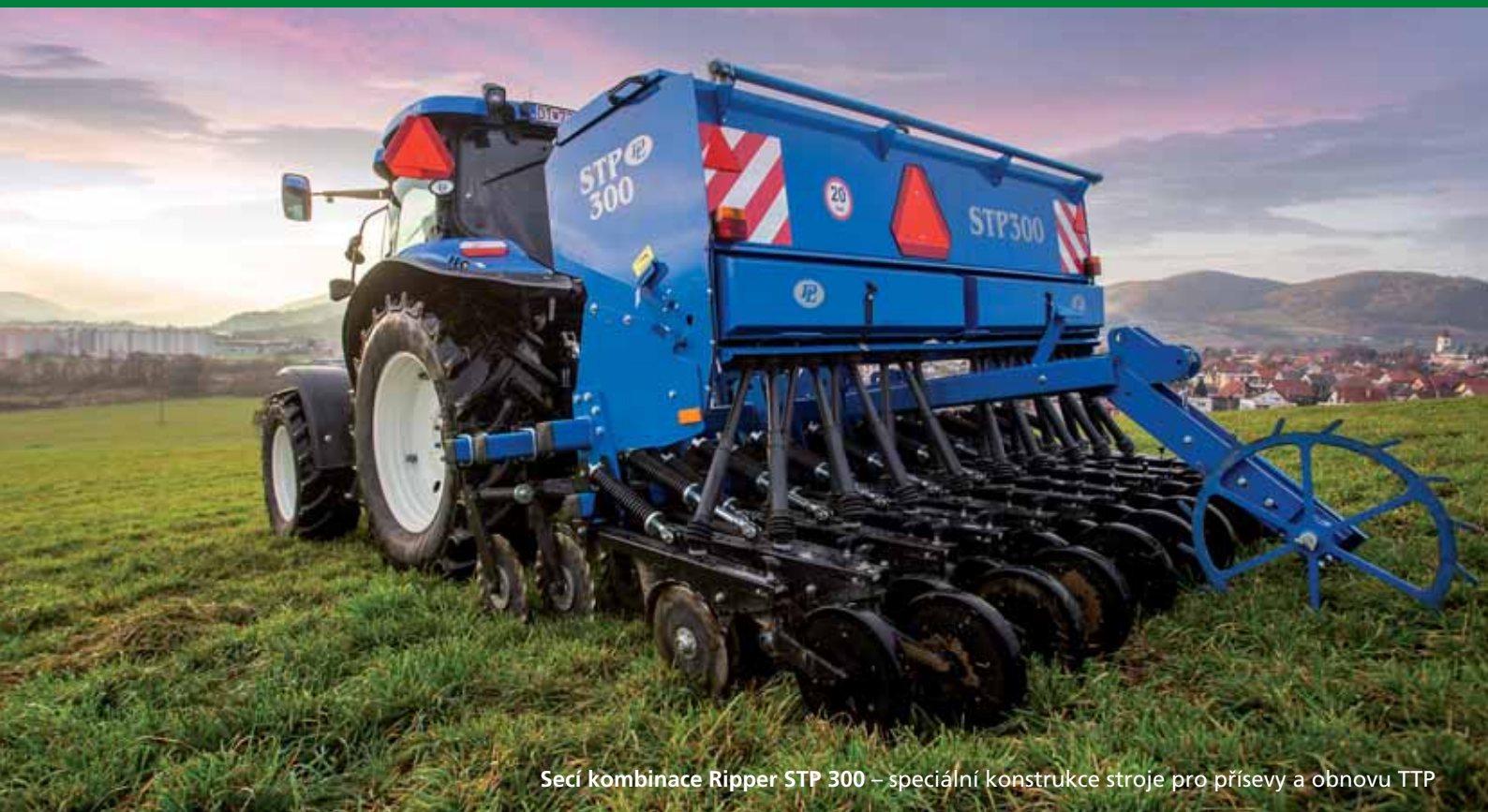
Secí kombinace Ripper STP 300 – speciální konstrukce stroje pro přisevy a obnovu TTP