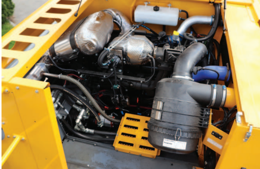
Obr.: Mlátičky Sampo pohání šestiválec AGCO Power.

Jak už bylo psáno výše v případě hybridního modelu, tak i ostatní modely Comia kladou důraz na snadné čištění a údržbu. V případě ucpá-