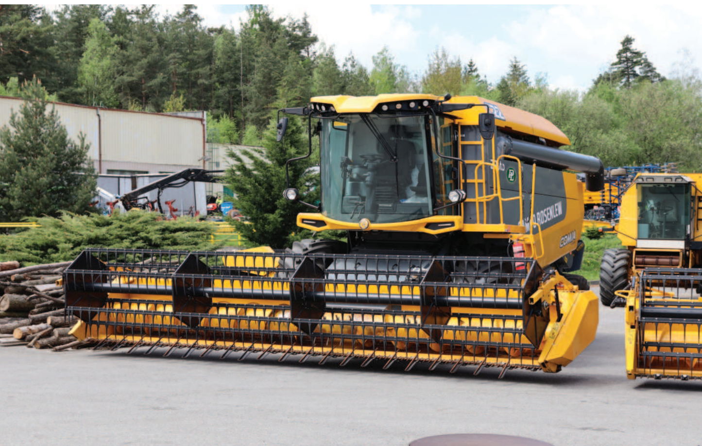
Obr.: U mlátičky C22 2Roto zajišťují čištění dva rotory, které jsou odpovědí na poptávku farmářů po co nejmenším poškození zrna a vyšší výkonnosti.