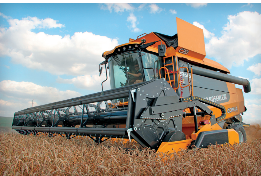
Nejmenší hybridní mlátičkou Sampo je model Comia C20 Roto