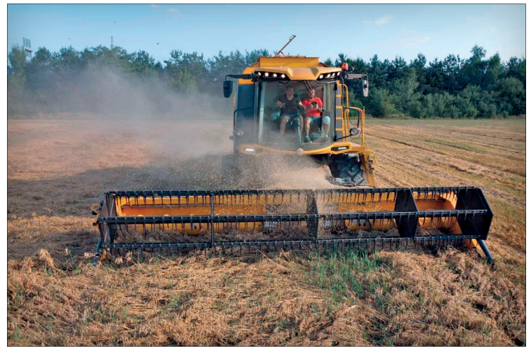
I s takovým porostem si finské mlátičky snadno poradí

Avara, která nabízí obsluhu dokonalý výhled na žací lištu a zcela nové ovládání. Základem je joystick propojený s komfortním sedadlem a velký desetipalcový dotykový displej. Veškeré ovládací prvky související s mlácením jsou dostupné z loketní opěrky. Jednou rukou se ovládá i dotykový displej rozdělený na dvě části se stálým a volitelným zobrazením. V části s volitelným zobrazením si může obsluha například zobrazit otáčkoměr, informace z kamery pro couvání, o ztrá-