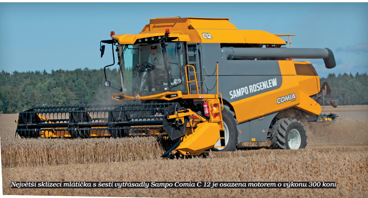
Největší sklízecí mlátička s šesti vytrásadly Sampo Comia C 12 je osazena motorem o výkonu 300 koní

U modelů Comia 2.0 se využívá centrální nasazení žacího stolu k mlátičce pomocí kardanového hřídele, což umožňuje příčné i podélné kopírování pozemku. Je možné připojit nejen standardní, ale i vario lištu o záběru až 7,5 metru, čímž se rozšiřuje spektrum sklízených plodin. Všechny mlátičky Comia využívají hydrostatický pohon přihaněče, který lze hydraulicky posouvat dopředu nebo dozadu. Pohonné jednotky všech mlátiček řady Comia disponují dostatečnou rezervou výkonu, pracují v nižších otáčkách