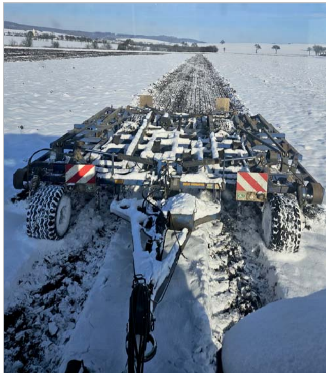
Kypřič Vario při zimním zpracování hrubé brázdy

Vario 480 pracuje v družstvu od roku 2010. Nejdříve v soupravě s traktorem New Holland o výkonu 170 k, což nebylo op-