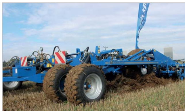
Čtyřřadý dlátový kypřič Vector